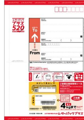
レターパックプラス必要枚数表